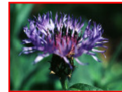
© Université Louis Pasteur (Strasbourg, France)